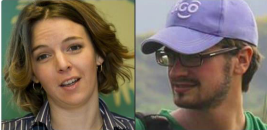
Les familles des experts exécutés en RDC réclament une enquête internatio... Les familles des deux experts des Nations unies exécutés en République démocratique du Congo (RDC) réclament une enquête internationale sur la mort de rfi.fr

#RDC #Kasai : Les familles des experts exécutés réclament une enquête internationale @miko75011 rfi.my/1EfW.t @RFI